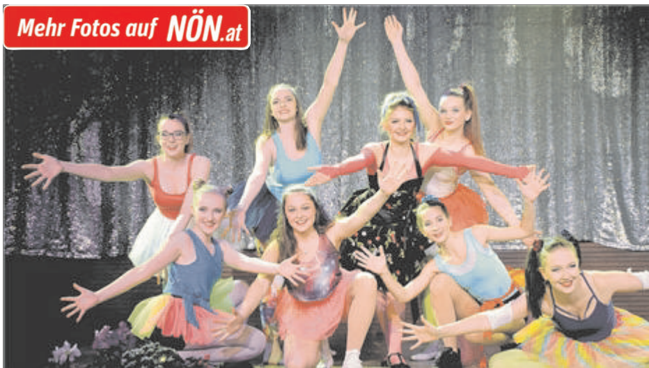
Mehr Fotos auf NÖN.at